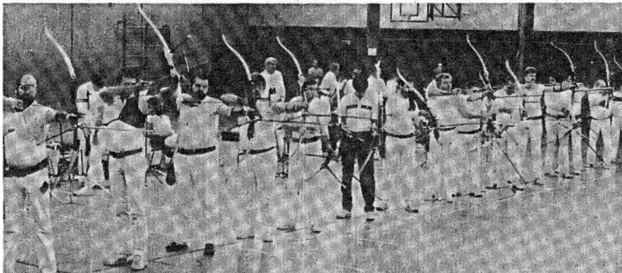
Fast 50 Schützen starteten bei den Hallenbogen-Kreismeisterschaften des Schützenkreises Calw in der Calmbacher Enztalhalle.

Spitzenbeteiligung bei den Kreismeisterschaften